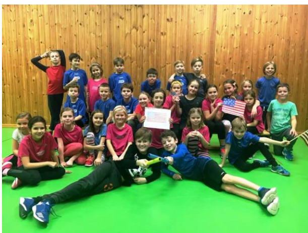
Skupinky dětí z atletické přípravy