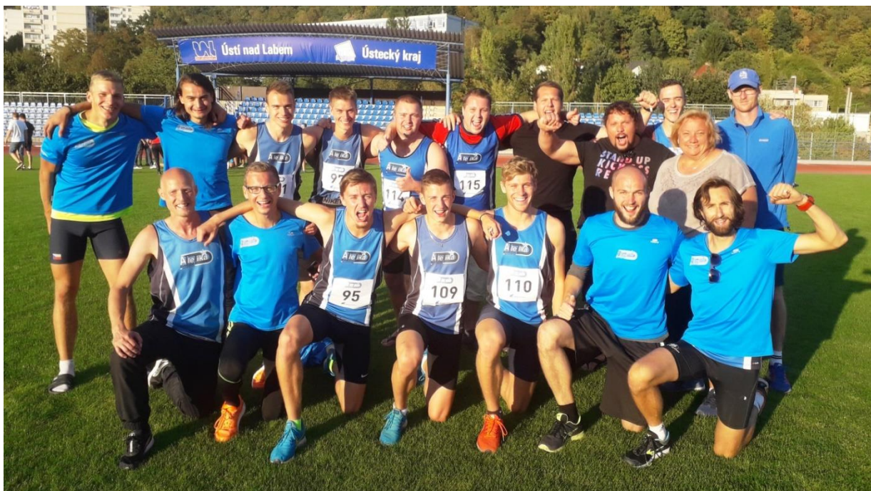
Družstvo mužů „A“ po obhájení extraligové příslušnosti