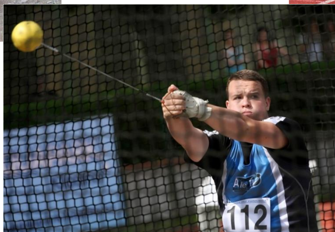
Tréninkové skupiny přípravky a žactva.