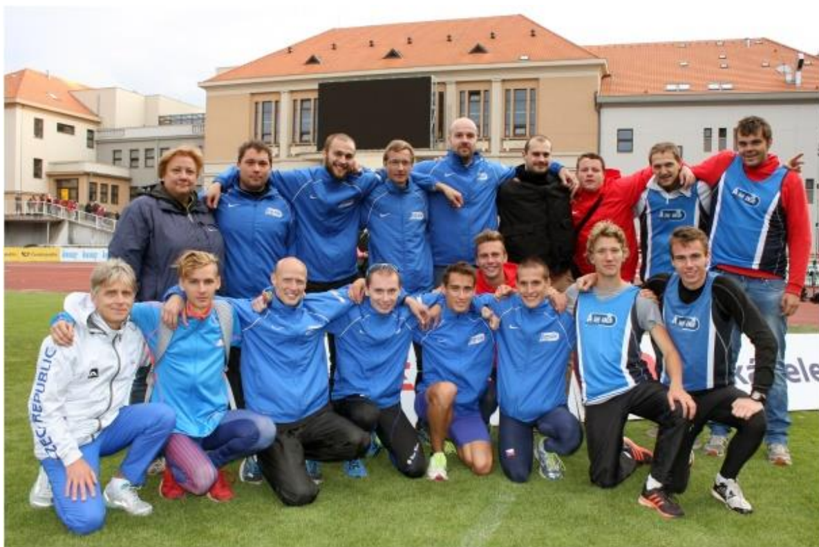
„A“ družstvo mužů – 2. místo na Mistrovství ČR.