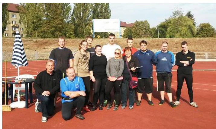
Účastníci vrhačského čtyřboje.