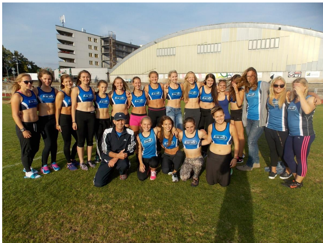
Družstvo dorostenek – 4. místo na Mistrovství ČR.