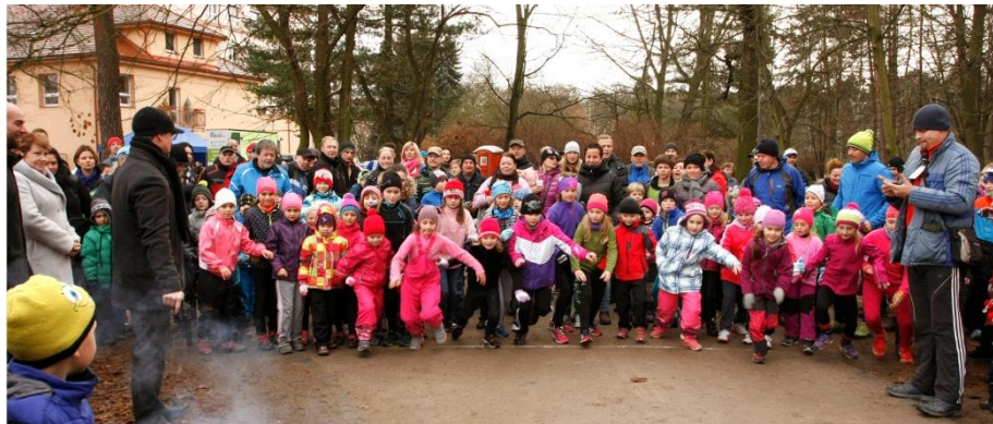
Start závodu nejmladších žákyně při Mikulášském běhu.